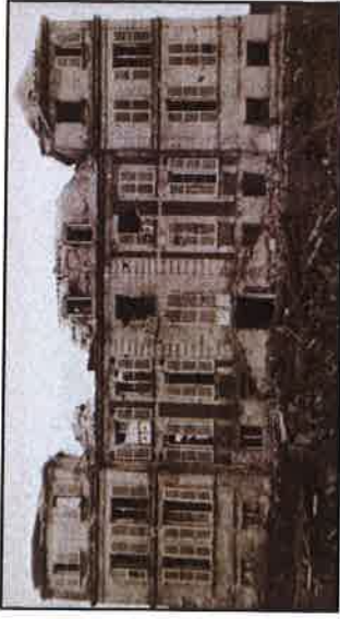
Le château de Morlincourt en 1918.